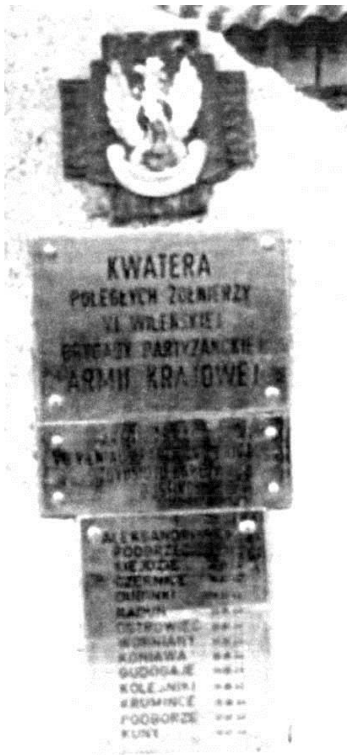
Koleśniki, rejon Soleczniki, Republika Litewska. Tablica epitafijna na cmentarzu brygadowym.