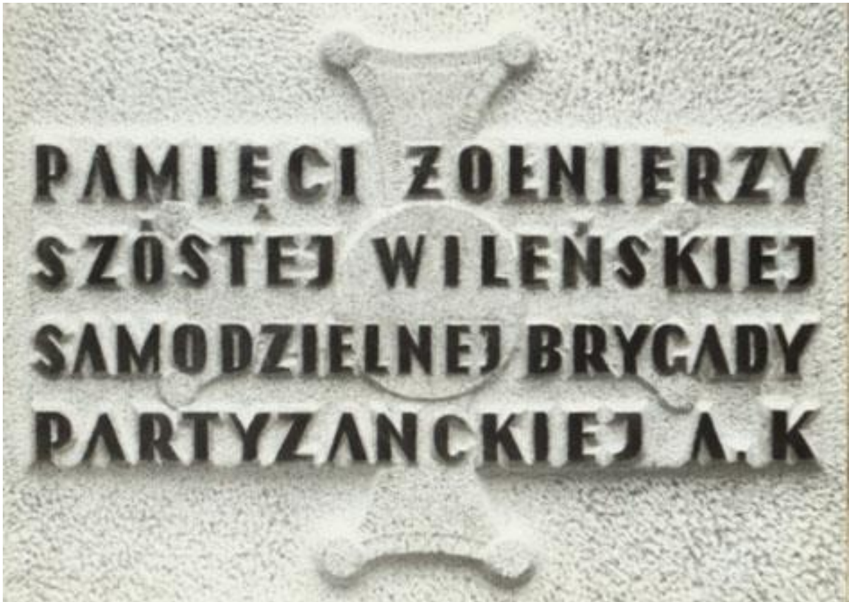
Tablica epitafijna odsłonięta i poświęcona 17.08.1975 r w kościele akademickim pod wezwaniem Św. Anny w Warszawie Krakowskie Przedmieście Nr 68.