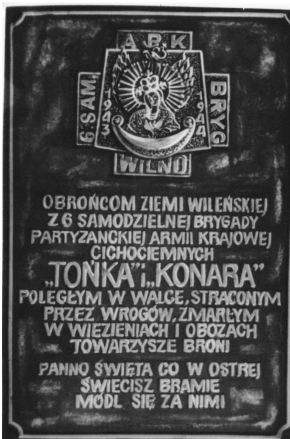
Tablica epitafijna żołnierzy 6 Brygady. W Bazylice Mariackiej w kaplicy Św. Barbary w Gdańsku.