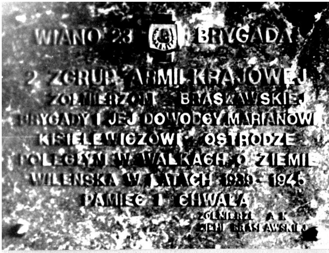
Brygadowa tablica epitafijna.